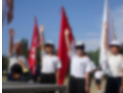
小中合同選手宣誓

9月17日、さわやかな秋空のもと、第11回小・中合同運動会を開催することができました。今年度は、入場制限を設けずに、地域の方々や50歳組、60歳組の方々にも御参加いただきました。子供たちは、それぞれの出場種目に精一杯頑張り、係の役割を果たし、充実した一日を過ごすことができました。御理解と御協力をありがとうございました。